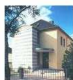
Brigitte Reimann Literaturhaus mehr