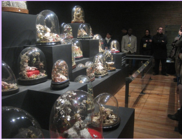
Museo La Merced