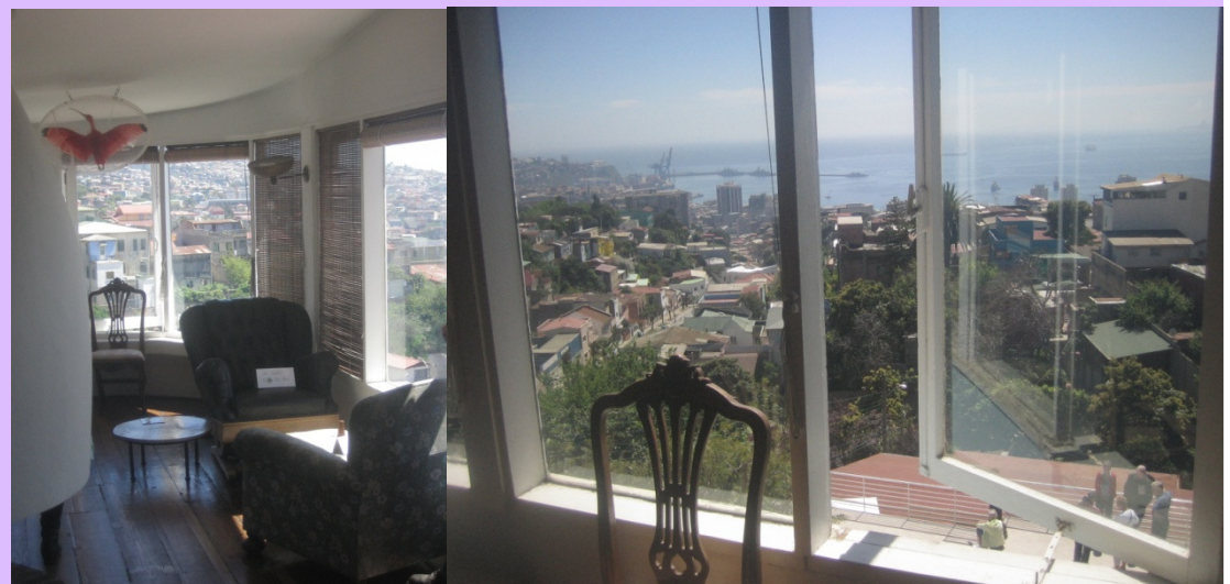
La Sebastiana – Casa Pablo Neruda