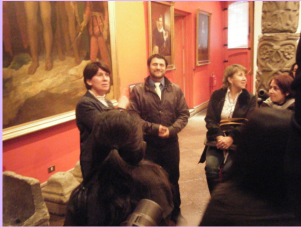
Museo Histórico Nacional