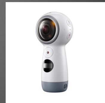
Samsung Gear 360 Horiz. 5.472 px (15 MP)