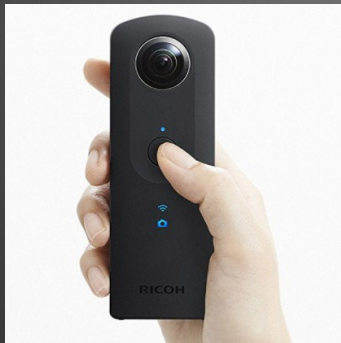
Ricoh Theta S Horiz. 5.376 px (14 MP)