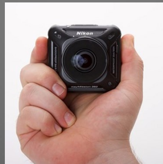
Nikon Keymission Horiz. 7.744 px (30 MP)