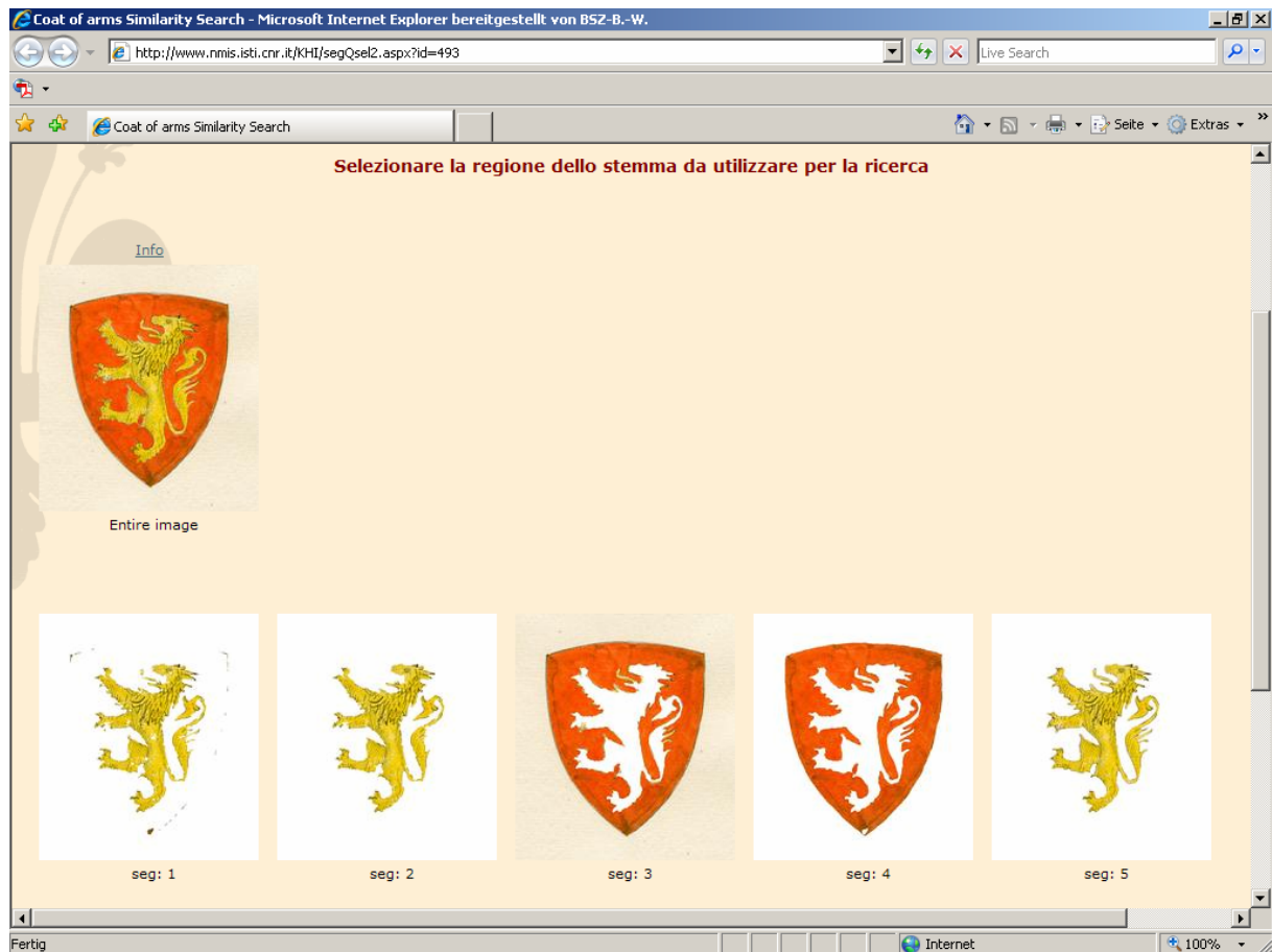
Abb. 2: Flächenzerlegung des Ausgangswappens in fünf Segmente