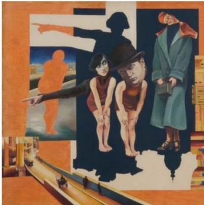
Roma Hannah Höch 1925