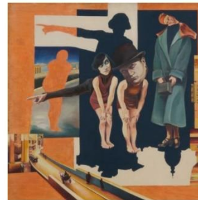
Roma Hannah Höch 1925